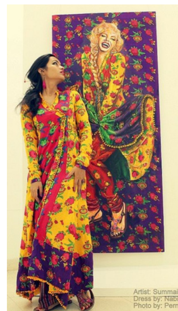
Artist: Summayh Dress by: Nabil

2/ Baeyyet, une organisation axée sur la musique et le théâtre, pourrait organiser un spectacle de musique soufie, mettant en vedette des airs classiques de Qawwali et mystiques, suivi d'un dîner traditionnel rendant hommage à la cuisine de Lahore.